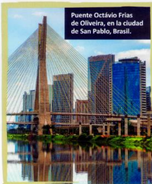
Ponte Octávio Frias de Oliveira, en la ciudad de San Pablo, Brasil.

Con los años, la ciudad siguió siendo un importante centro económico para el país y la región. También se convirtió en una ciudad con gran importancia cultural y educativa, con universidades, movimientos culturales y museos. En 2016, mediante una reforma política, cambió su nombre de Distrito Federal (DF) a Ciudad de México.