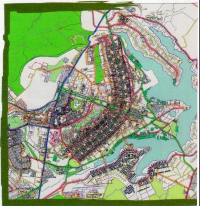
↑ Vista aérea de Brasilia, donde se observa el diseño urbano con forma de avión o ave.