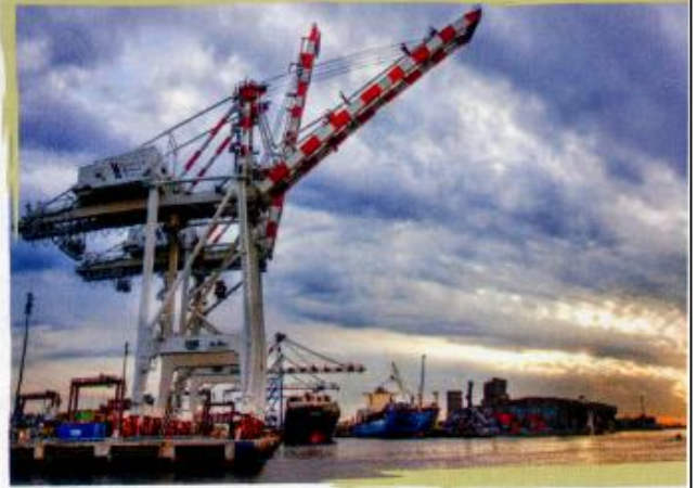
↑ Puerto de Buenos Aires.

El lugar elegido para construir la ciudad fue una extensa meseta en el sureste del Estado de Goiás. Las obras comenzaron en octubre de 1956 y, cuatro años después, Brasilia se convirtió en la capital de Brasil, la primera ciudad capital planificada construida en el siglo xx. El diseño del plano estuvo a cargo de Lúcio Costa, quien pensó una ciudad en forma de ave o de avión. Como el terreno era árido, se construyó una represa para abastecer de agua a la ciudad. Una de sus características urbanas es la presencia de amplias avenidas y del llamado Eje Monumental , donde se ubican los principales edificios gubernamentales y monumentos importantes de la ciudad.