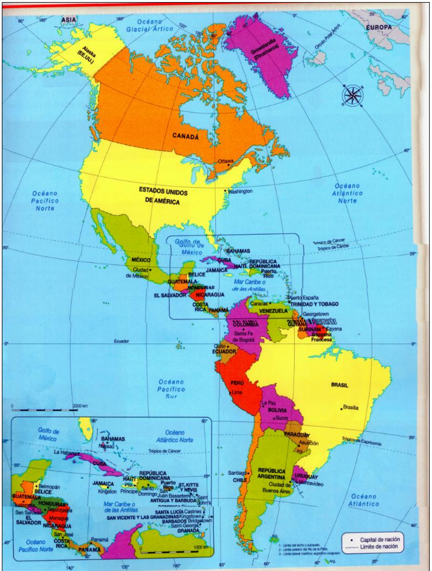
Mapa político de América.