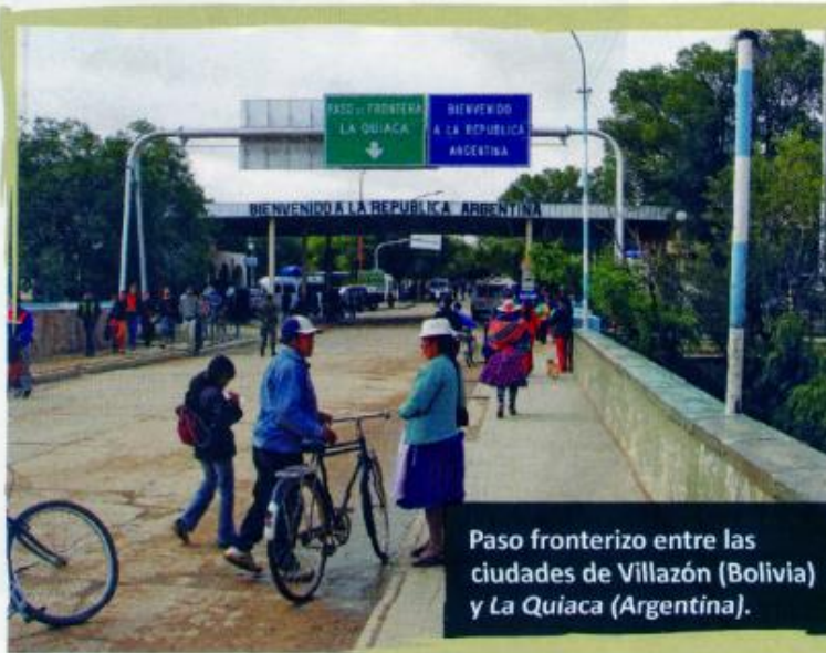
Paso fronterizo entre las ciudades de Villazón (Bolivia) y La Quiaca (Argentina).

En general, las personas de ambos lados de la frontera comparten costumbres festivas, música, comida y hasta el idioma, ya que de ese intercambio surgen palabras nuevas y dialectos como el "portuñol", que es la mezcla de español y portugués. Además, muchas personas viven en un país pero pueden trabajar, estudiar o comprar mercadería en el otro. De esta manera, el contacto e intercambio es permanente y da lugar al intercambio cultural. Como sucede en las poblaciones de las ciudades de Villazón, en Bolivia y La Quiaca, en la Argentina.