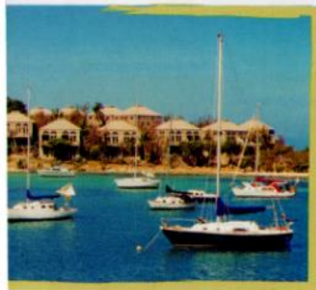
↑ Embarcaciones turísticas de las Islas Vírgenes Británicas.