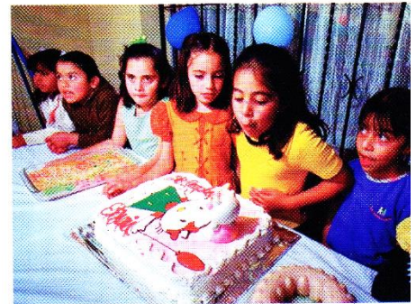
Festejar en familia y recibir regalos el día en que cumplimos años son costumbres que existen en todas las sociedades.